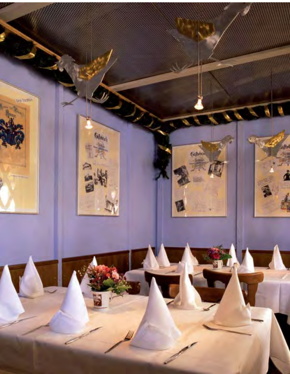
← The cock marks the entrance. Der Hahn markiert den Eingang. ↑ Flying ducks and pecking chickens. Flugenten und pickende Hühner. ← The Stüberl. Das Stüberl. ↓ Design sketch pecking chicken. Entwurfsskizze pickendes Hühner.